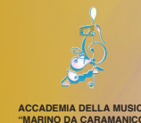
ACCADEMIA DELLA MUSICA "MARINO DA CARAMANICO"

manifestazione di interesse internazionale